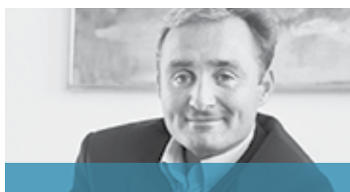
Christian Gangsted-Rasmussen Advokataktieselskabet Gangsted-Rasmussen