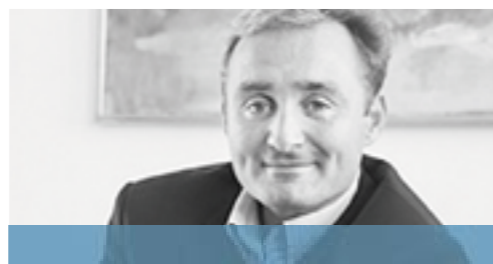
Christian Gangsted-Rasmussen Advokatfirmaet Gangsted-Rasmussen